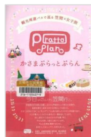
『かさまぶらっとぶらん』 /笠間市商工観光課

笠間市を紹介した素敵なフリーペーパー等図書館にあります。ぜひお出かけの参考にご覧ください。