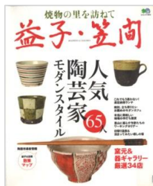
『焼き物の里を訪ねて 益子・笠間』/樫出版社