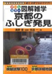
『図解雑学 京都のふしぎ発見』 杭迫一著／ナツメ社