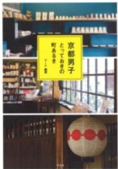
『京都男子 とっておきの町あるき』 ワード編著／平凡社